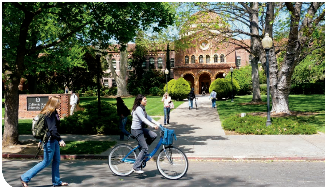
Os alunos apreciam o clima brando, o ano inteiro, em Chico.

Quando não estou estudando, é fácil encontrar algo para fazer em Chico. Gosto de fazer caminhadas pela cidade, ir ao clube, e tenho me divertido indo esquiar em Mount Shasta e Lago Tahoe.