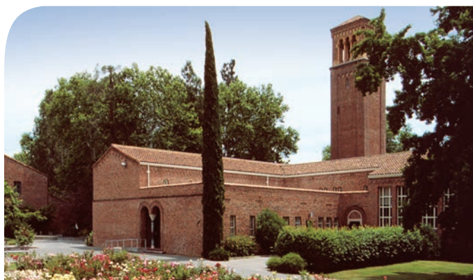
Jardins de rosas e árvores proporcionam um lindo ambiente de aprendizagem.