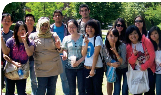
Alunos do ALCI comemoram sucesso acadêmico com uma foto coletiva.