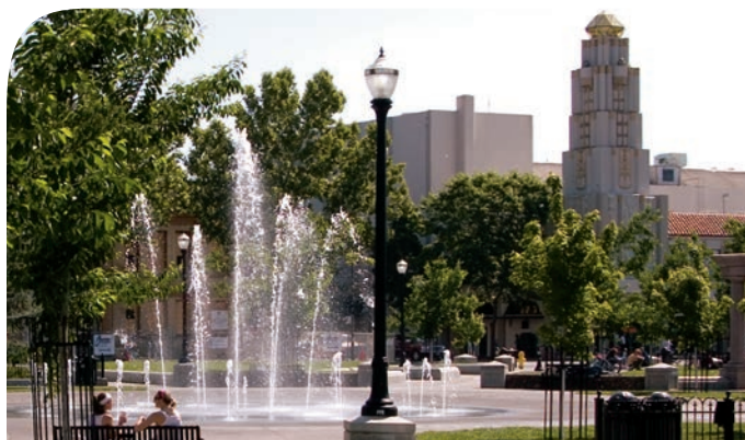
As pessoas encontram tempo para relaxar em um dos muitos parques de Chico.