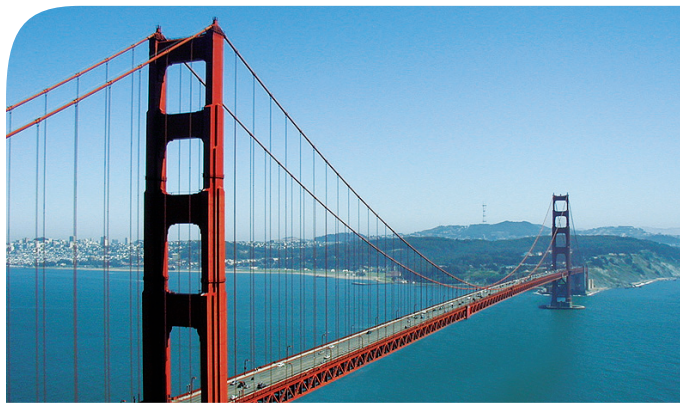
Ponte Golden Gate, São Francisco.